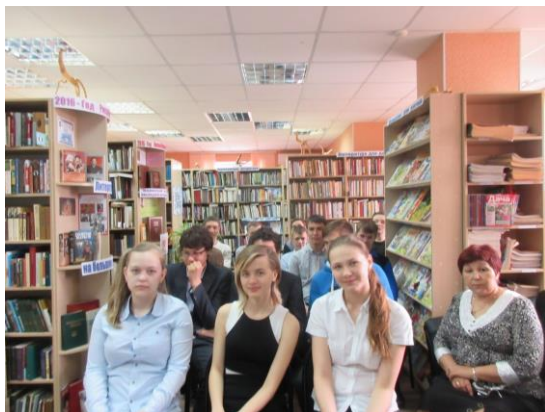
Видеолекторий «Выбираем жизнь».

Мы предлагаем читателям и пользователям библиотеки альтернативу нездоровому образу жизни. Ведём просветительскую работу, стараемся заинтересовать молодёжь разнообразными увлечениями и донести мысль, что в реальной жизни есть очень много интересного и полезного для них: чтение книг, занятие спортом, увлечение музыкой, туризмом и т.д.